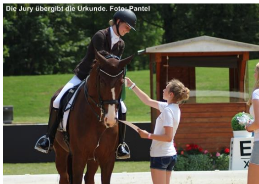
Die Jury übergibt die Urkunde.

Mit dem 8er-Team möchten die Persönlichen Mitglieder stilistisch sauberes, korrektes und pferdefreundliches Dressur-, Spring- und Geländereiten im Ländle belohnen. Mit dieser Aktion werden Reiter aller Altersklassen erfasst, die im Zeitraum von Januar bis September eines Jahres in einer Dressur-, Spring- oder Geländeprüfung der Klassen E bis M* (ausgenommen Aufbauprüfungen für junge Pferde) eine Wertnote von 8,0 und besser erreichen konnten. Diese werden dann zu einem gemeinsamen Finale in ihrem entsprechenden Landesverband eingeladen.