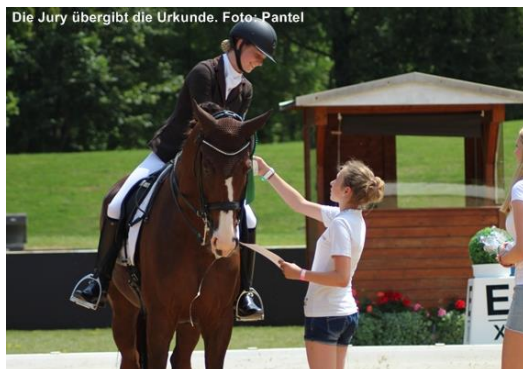
Die Jury übergibt die Urkunde.

Mit dieser Aktion werden Reiter aller Altersklassen erfasst, die im Zeitraum von Januar bis September eines Jahres in einer Dressur-, Spring- oder Geländeprüfung der Klassen E bis M* (ausgenommen Aufbauprüfungen für junge Pferde) eine Wertnote von 8,0 und besser erreichen konnten. Diese werden dann zu einem gemeinsamen Finale in ihrem entsprechenden Landesverband eingeladen.